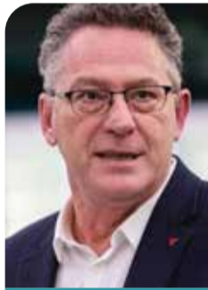
Κώστας Αρβανίτης Ευρωβουλευτής ΣΥΡΙΖΑ