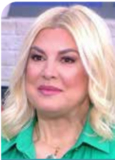
Ράνια Θρασκιά Βουλευτής ΣΥΡΙΖΑ