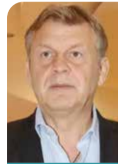
Απόστολος Γκλέτσος Υποψήφιος πρόεδρος ΣΥΡΙΖΑ

Διότι ερμήνευσε τον ορισμό Τζιτζικώστα ως Επιτρόπου Μεταφορών ως κυβερνητική προσπάθεια να «κουκουλωθεί» το θέμα των Τεμπών